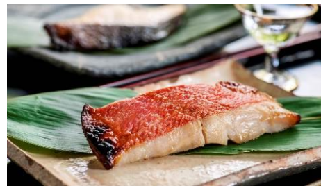
＜葉山 日影茶屋＞西京漬6枚 5,400円（税込） （真鯖・紅鮭各2，金目鯛・銀鱈各1）