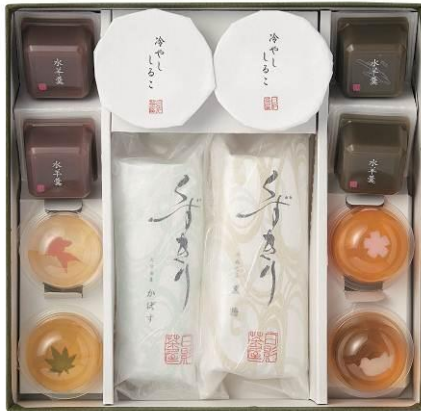
＜葉山 日影茶屋＞ 日影涼菓詰合せ 3,240円（税込）