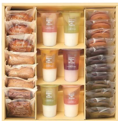
【京急百貨店オリジナル】 ＜ラ・マーレ・ド・チャヤ＞ ゼリー焼菓子詰合せ オリジナル26個入 5,400円（税込）