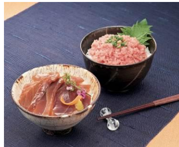
上段<三崎港 丸福水産> 三崎港まぐろ詰合せ