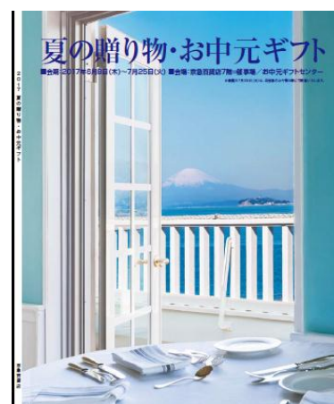
※カタログ表紙イメージ