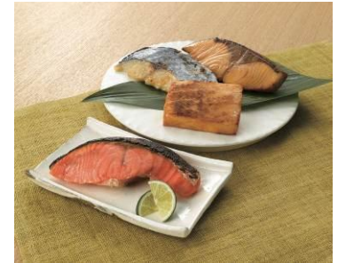
下段<三崎恵水産> バラエティセット