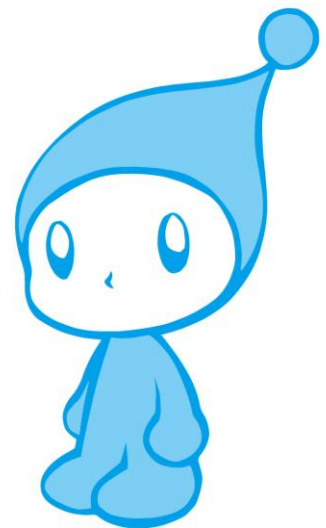
アーティスト 竹本真紀さんが描きおろした 「Kボーヤ」を探そう！