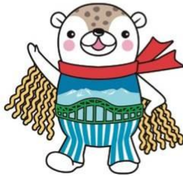
【旭川市PRキャラクター】