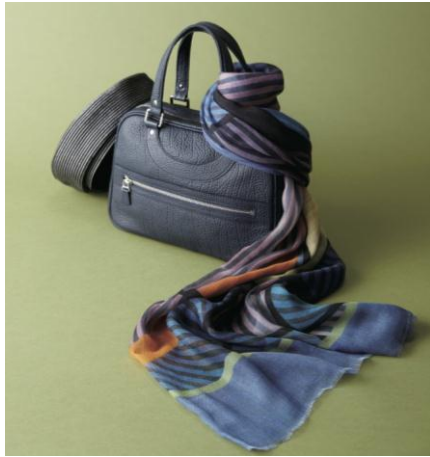
【ジャック・ル・コー】バッグ