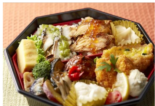
【e a s h i o n】