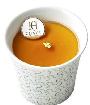
【ラ・マーレ・ド・チャヤ】