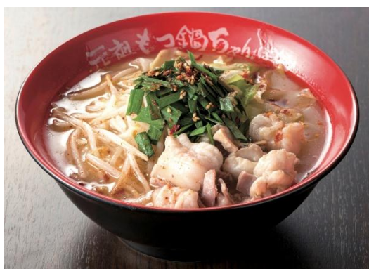
もつ鍋ちゃんぽん（醤油，味噌，塩） (1人前) 各918円 (税込)