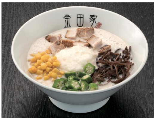
山芋とオクラで夏バテ解消！ 魚介風味 金田家 ベジタブルラーメン (1人前) 1,242円 (税込)