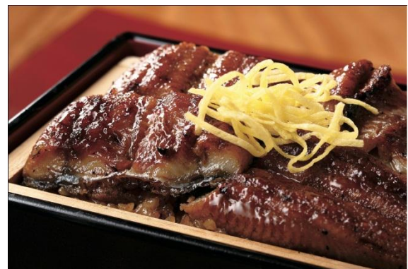
うなぎの旨味がご飯に染み込み うなぎはふっくらボリューム満点 うなぎせいろ蒸し (1折) 2,592円(税込)