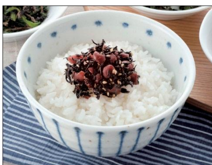
【太宰府市 太宰府えとや】 梅の実ひじき (150g) 702円(税込)