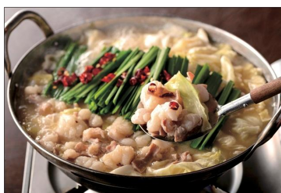
お持ち帰り用 博多もつ鍋 (醤油・味噌・塩，冷凍) (2人前) 2,808円 (税込) ※イートインメニューにはございません。