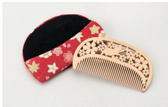
【福岡市 匠工芸】 透かし彫櫛『花と子猫』 (約10×5.5cm, 材質: つげ・珊瑚) 《限定3点》 32,400円(税込)