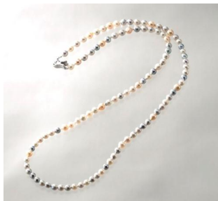
特別提供品【福岡市 KOSHO JEWELRY】 あこや真珠 マルチロングネックレス (約6～8mm珠, 全長約80cm) 《限定3点》 37,800円(税込)