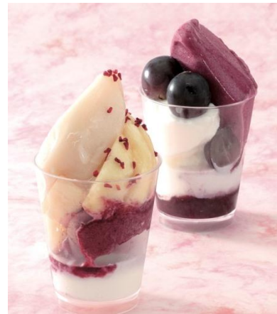
(左) 桃のパフェ (1コ) 864円(税込) (右) ぶどうのパフェ (1コ) 864円(税込)