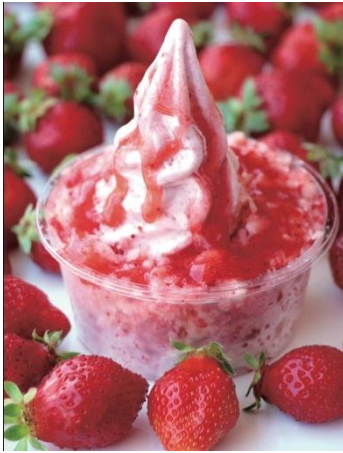
完熟あまおうの サクサクいちごパラダイス (1コ) 821円(税込)