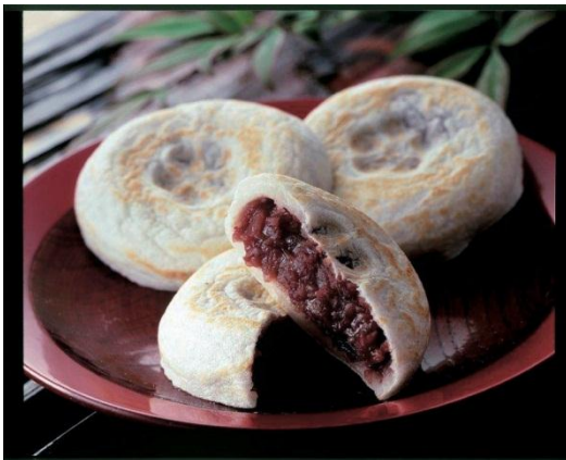
中はふんわりモチモチの食感が 楽しめる素朴な味わい 梅ヶ枝餅 (5コ入) 651円(税込)