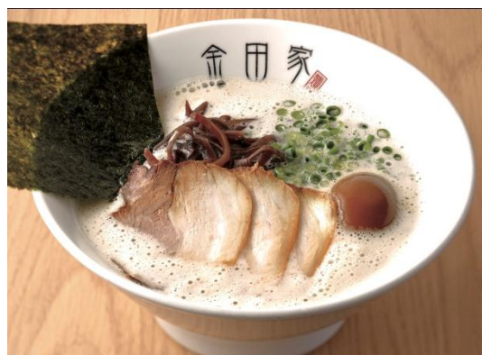
自慢の黒豚と泡系とんこつスープを堪能！ 黒豚らーめん煮玉子入り (1人前) 851円 (税込)