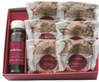
【ラ・ベッタラ・ダ・オチアイ】 ハンバーグと黒トリュフソース 5,400円（税込）