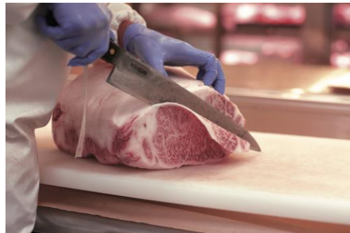
銘店【日本橋日山】が選りすぐったブランド牛肉