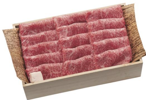
【日本橋日山】 葉山牛ロースすき焼き用 27,000円(税込)