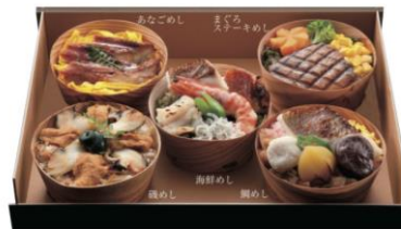
【割烹平家】 海鮮わっぱめし 5,940円（税込）