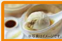
【四五六菜館】 四五六小籠包 点心中品評会で金賞を受賞したモチモチの皮とジューシーな餡が自慢の小籠包です。