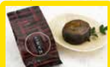
【横濱しげた】 横浜黒月餅 あっさりとした和風の月餅です。胡桃をたっぷり入れた胡麻餡を竹炭入りの黒い生地で包みました。