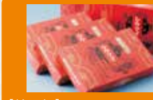
【崎陽軒】 真空パックシウマイ 横浜といえば、【崎陽軒】のシウマイのこの赤い包装紙。すっかりそのイメージは定着しました。