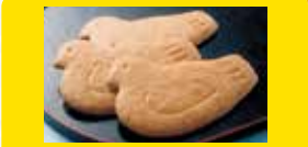
【豊島屋】 鳩サブレ バターたっぷり、ハイカラな鎌倉の味として親しまれております。さびしや小鳩豆菓もお取り扱いはしております。