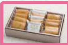
【横浜 かをり】 レズンサンド・ ブランデーケーキ詰合せ ブランデーに漬け込んだレズン生をバターのたっぷり入ったクッキーでサンドした【かをり】定番のレズンサンド、ブランデーケーキはチョコとバナナの2つの味をお楽しみいただけます。