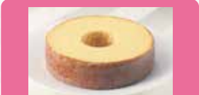
【ストラスプール】 テラバウム しっとりとした食感と上品な風味のテラバウムは、【ストラスプール】の定番でくせになるおいしさです。