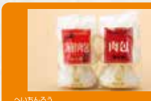
【聘珍樓】 肉まん・海鮮まんセット 横浜中華街を代表する広東料理の老舗の、点心師が作り上げる人気の品です。