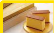
【横濱 文明堂】 極上金かすてら このカステラの特徴を一言でいえば濃厚なカステラ味…卵のお好きな方にぴったりなこのカステラは、卵の卵黄だけを通常のほぼ2倍用いて焼き上げました。