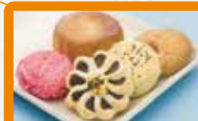
【華正樓】 中華菓子詰合せ 厳選した素材にこだわり、中華菓子の代表ブランドとして代々親しまれている銘店です。