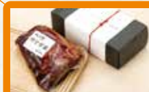
【尾島商店】 濱吟焼豚(真空パック) 厳選した国産豚のみを使用し、秘伝のタレに漬け込み、炭火でじっくりと焼き上げました。