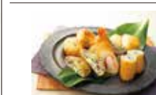
【能登屋】 横濱セット(さつま揚げ9種入) 美味しさと安心のおすそわけ。ちょっとしたお土産やプレゼントに最適です。