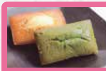
【ラ・マレード・チャヤ】 フリアン詰合せ 和の素材を使用し、味わい豊かにとりと焼き上げたフィナンシェです。