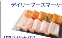
【羽床総本店】 白皮かじき味噌漬・粕漬詰合せ 10切入(各5切) 漁獲量が非常に少なく希少価値が高い白皮が、くせがきっぱりとした味わいが広がります。当社創業以来、伝統の逸品です。