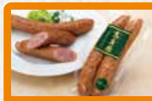
【ローゼンハイム】 高座豚ウィンナー かながわ産100選にも選ばれている高座豚は、神奈川県内の提携農家でのみ生産されている逸品です。