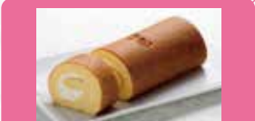
【鎌倉ニュージャーマン】 かまくらロール かまくらカスターのスポンジ生地で巻き上げたロールケーキです。