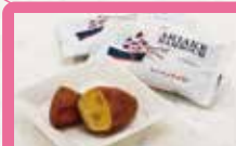
【ありあけ本館 ハーバースムーン】 横濱ハーバー ダブルマロン 薄くソフトなカステラ生地に、粒栗入りの栗餡をやさしく包んだマロンの味わいが絶妙です。