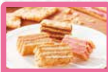
【ガトー・ポワイヤージュ】 横浜馬車道ミルフィユ 4層のパイと3層のクリームのミルフィユ、パイのさくっり感ととろけるクリームとのハーモニーが絶妙です。