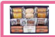
【横濱元町 霧笛楼】 霧笛楼ギフトセット 人気の横濱煉瓦・白煉瓦に、香ばしいアーモンド菓子の横濱仏蘭西瓦とバラエティー豊かな焼菓子が入ったギフトセットです。