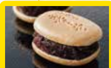
【諸国銘菓【夢うらら】】 【本牧 喜月堂本店】 喜最中 創業100年以上の横浜を代表する老舗の菓子店、船がはみ出すほど盛り込んだ【喜最中】は【喜月堂】の代表銘菓です。