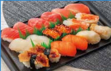
①上にぎり鮭2人前(1パック) (各日限定50点).....税込1,980円

■5月22日(金)~27日(水) ※天候により仕入れ内容が変更となる場合がございます。