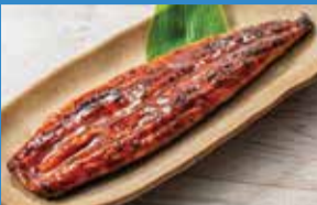
①うなぎ長焼(養殖、鹿児島産他、1尾) (各日限定50点).....税込1,500円