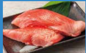
①金目鯛切身半身(1パック) (各日限定50点).....税込1,080円