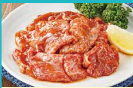
【日本橋日山】①牛味付肉(250g)(各日限定30点).....税込1,080円