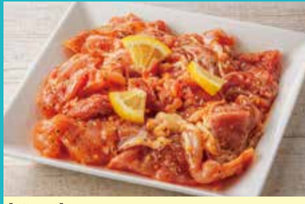
【鶏三和】①レモンペッパーステーキ(500g)(各日限定30点).....税込1,300円