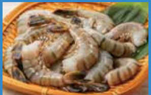
①ブラックタイガー海老(養殖、解凍、インド産他、15尾) (各日限定50点).....税込1,280円