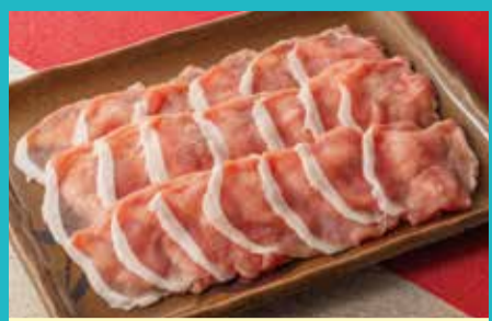
【肉の匠いとう】①国産豚ロースしゃぶしゃぶ用(350g)(各日限定30点).....税込1,080円