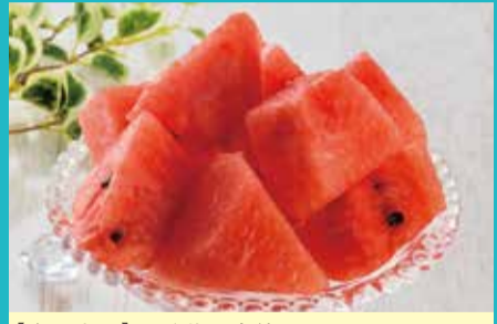
【青果売場】①千葉県産他カットすいか(ブロックカット、1パック)(各日限定30点).....税込499円