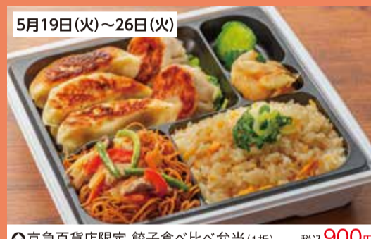
①京急百貨店限定 餃子食べ比べ弁当(1折).....税込900円