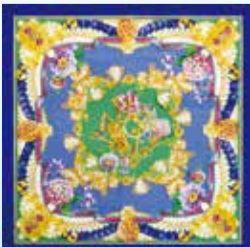
関東学院大学所蔵 スカーフデザイン画

かつて大岡川沿いに横浜スカーフの捺染工場が立ち並んでいた上大岡の街。この地にゆかりのある横浜スカーフの歴史とデザインの魅力を伝える展示を関東学院大学と開催します。