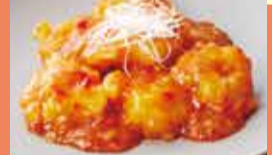
①海老のチリソース(100g).....税込600円