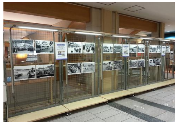
※10階レストランフロア パネル展の様子

思い出がたくさん詰まった横浜・横須賀・三浦の街並みや建物など、懐かしい生活の情景を収録した写真集の販売を記念しパネル展を開催します。