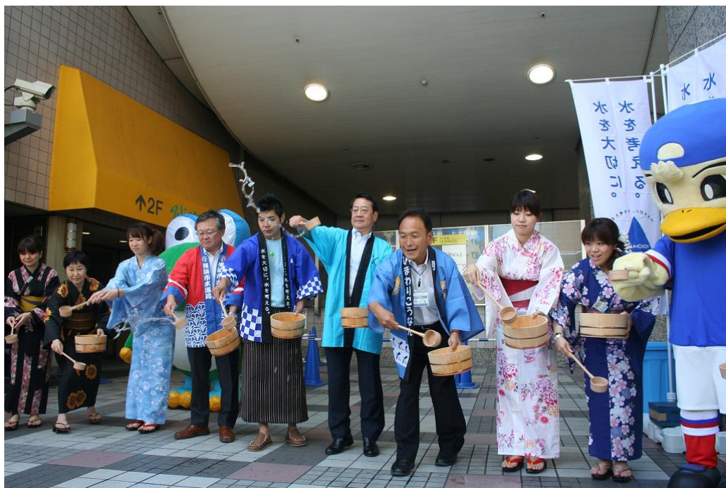
【昨年の「打ち水」イベントの様子】

全館のイベントとして，横浜市水道局とタイアップして行う「YOKOHAMA save the water 2013 水と緑のスタンプラリー」，港南区とタイアップしてお客さま参加型で行う「打ち水」やお子さまと百貨店社員が一緒になって実施する「子ども縁日・京急盆踊り大会」など，本年は新入社員を含めた若手社員が中心となって運営を行い，地域やお客さまとのコミュニケーションを図り，イベントを盛り上げてまいります。その他、各階フロアにおいてもキャラクターイベントや工作教室をご用意しております。詳細は以下のとおりです。