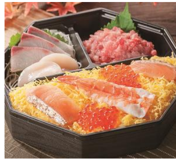
【三崎豊魚】海鮮贅沢弁当