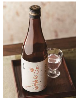
明日香 (あすか) 純米吟醸

芋の香りがほどよくあり、飲み口も非常に滑らかで余韻も長くキレがよい焼酎が出来上がりました。