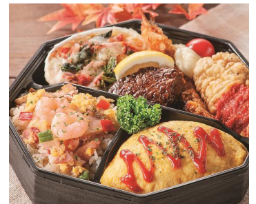
【ホワイトベア】にぎわい洋食弁当