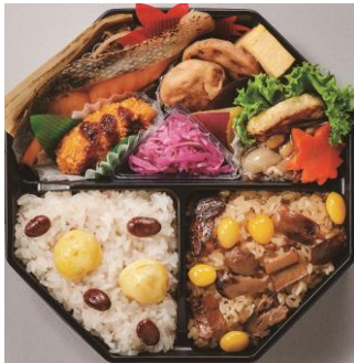
【米八】秋の感謝弁当