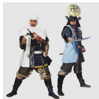
上杉おもてなし武将隊