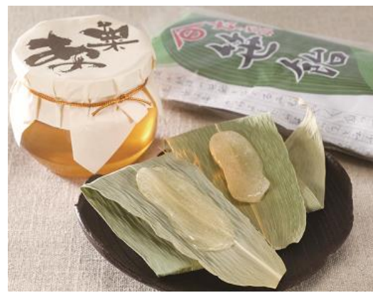
【高橋孫左衛門商店】

初代高橋孫左衛門によって製造され、江戸時代から約390年続く餡一筋の古典的銘菓の栗餡と笹餡をご賞味ください。