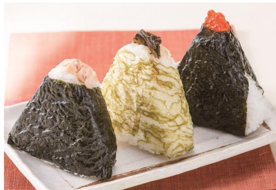
【新潟市/茂太郎商店】