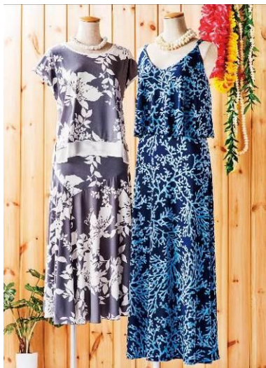
左【ピカケ】フレンチトップス 9,720円(税込) アシンメトリーティアードスカート 16,200円(税込) 右【ハレクーアイレア】コーラルドレス (M・L) 10,260円(税込)