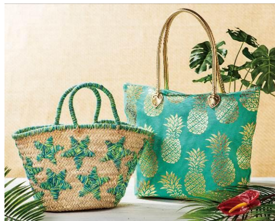
左【セブンマイルズクラブ】カゴバッグ 9,720円(税込) 右【フラフルーツ】 パイナップルトートバッグ 10,260円(税込)