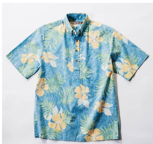
【アロアロ】アロハシャツ 19,440円(税込)