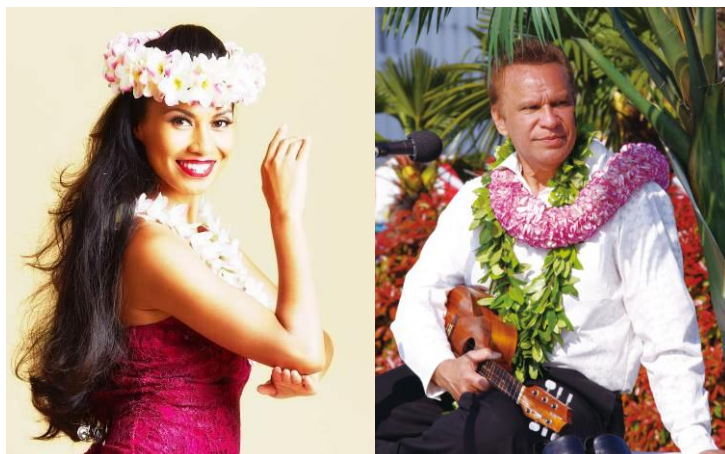
6日間で35ステージ開催! 実力と美貌を兼ね備えたダンサーたちの白熱ショー