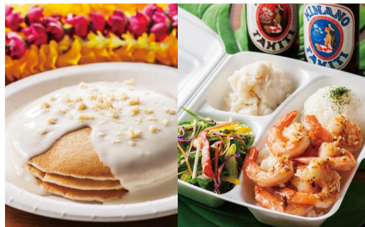
「ホノルル食堂」×「ダ・カフェ」 パンケーキやガーリックシュリンプをその場で♪