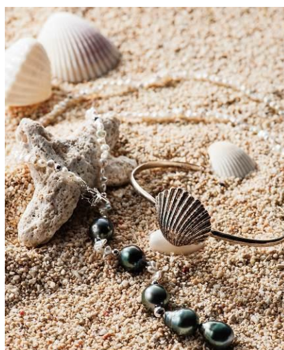
《特別ご提供品》【エスクーニィ】 タヒチアンブラックパールとケシパールのネックレス 89,640円(税込) 【セブンマイルズクラブ】シルバーバングル 10,584円(税込)