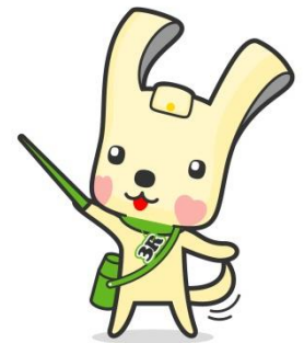
「ヨコハマ3R夢！」 マスコット『イーオ』