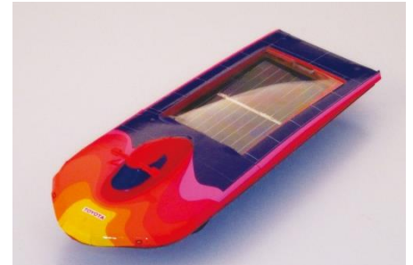
ソーラーカー（イメージ）