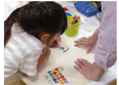
エコバッグ作り（イメージ）