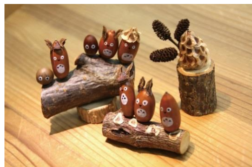
県内でとれた枝木や木の実を使った クラフトワークショップを開催！