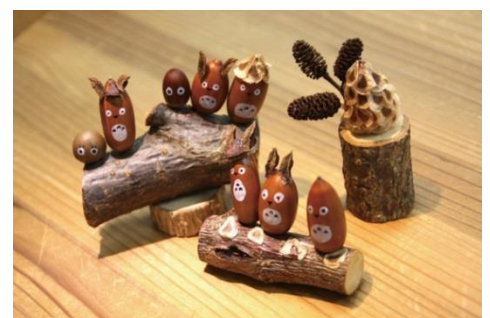
クラフトワークショップ（イメージ）