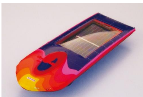
再生可能エネルギー ソーラーカーを作ってみよう！