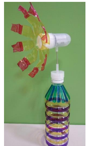
制作するペットボトル（イメージ）