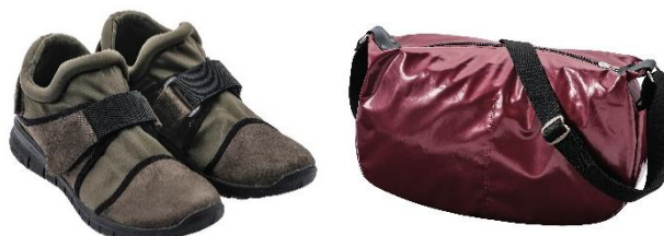
『秋！アクティビティの旅』お楽しみ袋