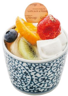
【ガトー・ド・ボワイヤージュ】