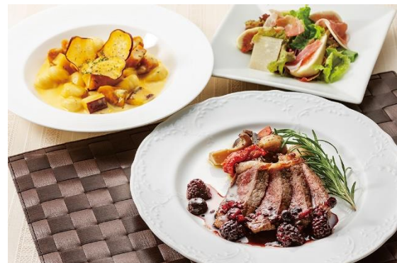
イタリア料理【ターボロ・ディ・フィオーリ】