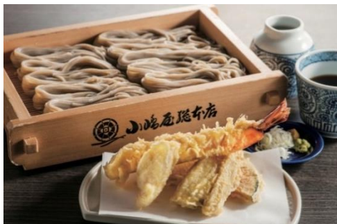
海鮮極み天へぎそば 《各日限定40食》(1人前)2,200円(税込)