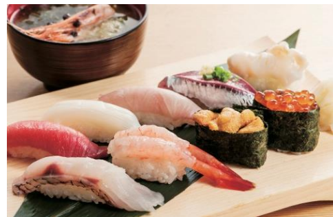
弁慶 スペシャル握り 2,420円(税込)