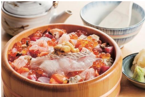
弁慶 日本海 海鮮ひつまぶし 2,200円(税込)