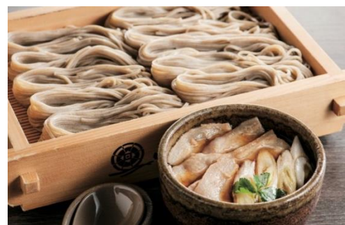
新潟県産地豚 妻有ポークのつけへぎそば 《各日限定30食》(1人前)1,430円(税込)