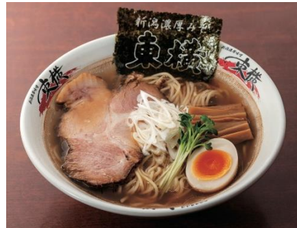
割りスープを加えたマイルドなラーメン 新潟あっさり醤油ラーメン (1人前)・・・781円(税込)