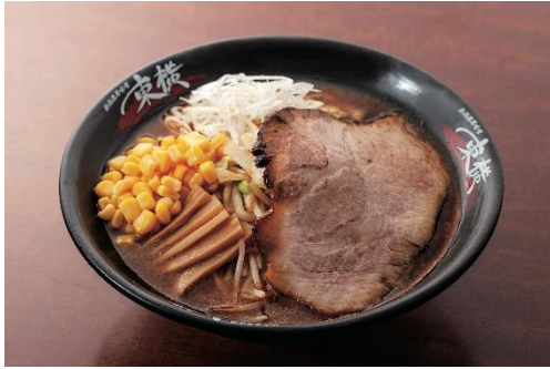
味噌ダレのガツンとくる濃厚な味わい 濃厚特製野菜味噌ラーメン (1人前)・・・1,051円(税込)