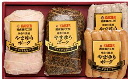
【カイゼルハム】 やまゆりポークハム詰合せ 5,400円（税込）