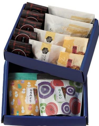
〈京急オリジナル〉 かながわ個箱〈常温2段〉 5,400円（税込）