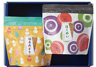
〈丹沢遠山茶高梨茶園〉 煎茶味わいセット