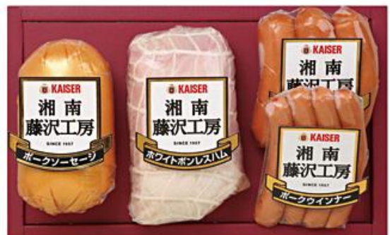
【カイゼルハム】 湘南藤沢工房ハム詰合せ 5,400円（税込）