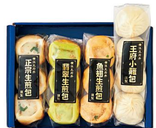
〈横浜中華街 王府井〉 小籠包対決セット