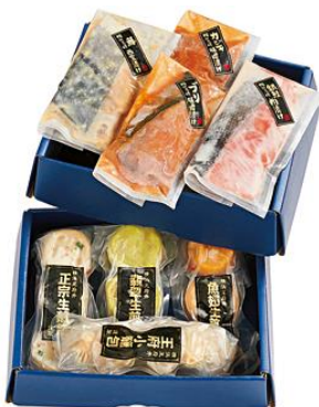
〈京急オリジナル〉 かながわ個箱〈冷凍2段〉 5,400円（税込）