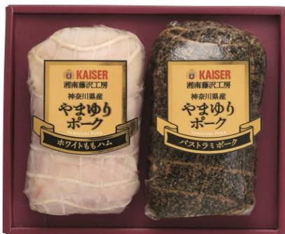
【カイゼルハム】 やまゆりポークハム詰合せ 4,320円（税込）