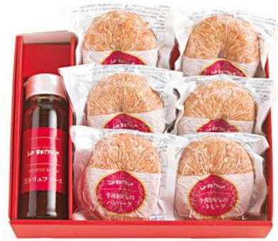
〈ラ・ベットラ・ダ・オチアイ〉 落合務監修 ハンバーグと黒トリュフソース 5,400円(税込)