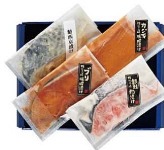
〈城ヶ島・三崎恵水産〉 バラエティセット