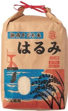
《JA湘南》 神奈川県産米「はるみ」 3,240円（税込）

名前は「湘南の晴れた海」に由来。 つやがあり強い甘みの特徴で冷めても硬くなりにくい 品種のため、お弁当やおにぎりなどにも適しています。 平成28-29年産米2年連続で 「米の食味ランキング」特A評価獲得。 ※こちらの商品そのものに対する評価ではございません。