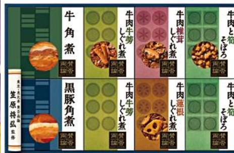
〈賛否両論〉 しぐれ煮・角煮詰合せ 5,400円(税込)