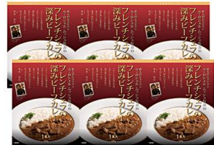
〈ラ・ロシエル〉 坂井宏行監修 フレンチシェフの深みビーフカレー 3,888円(税込)