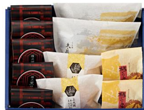
〈横濱 しげた〉 上大岡あんぱんまんじゅう・ 久良岐・横浜黒月餅セット