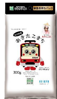
「あきた eco らいす」 けいきゅんオリジナルパッケージ 1袋(300g)