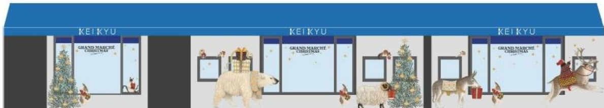
1階ショーウィンドウ イメージ

1階ショーウィンドウや、3階正面入口など、店内各所にて、“おとぎの国”をテーマに、動物たちが集う賑わいのあるクリスマスを表現し、通勤・通学で上大岡駅をご利用の方にもクリスマス気分を感じていただけるプロモーションとなります。