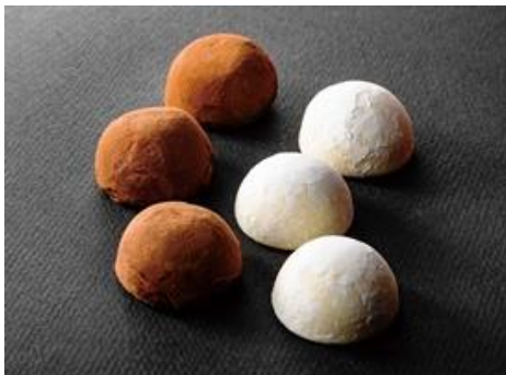
《焼酎チョコアソート》