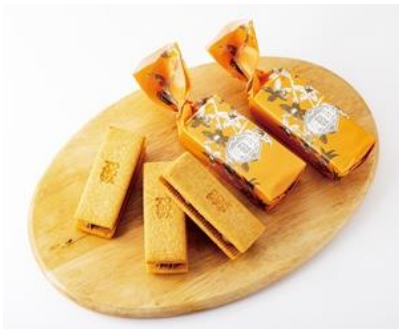
《バターサンド淡路島なるとオレンジ》 (6コ入) 1,296円 (税込)