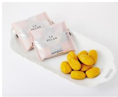
《ラ・ラ・ラ ピーカン10》 (10袋入) 1,251円 (税込)