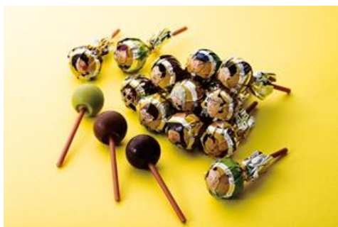
《ボンボンタウンギフトボックス》