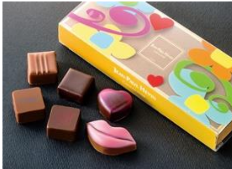
《ボンボン ショコラ 6個 アネポップ》