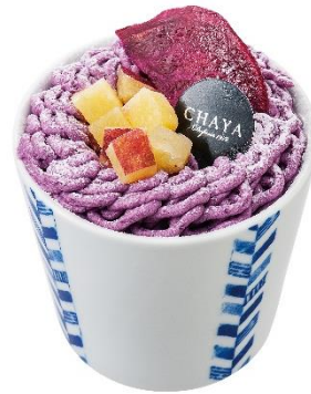
【ラ・マーレ・ド・チャヤ】