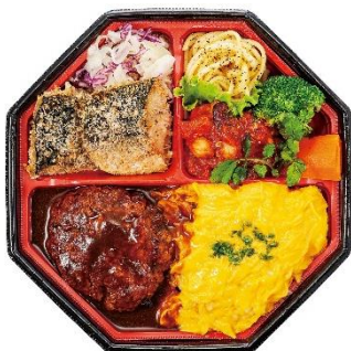
【ビストロ 6 3 4】

中島水産特製の西京味噌に漬けたサーモンに, 秋が感じられるきのこご飯が楽しめるお弁当です。