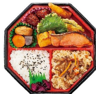
【さかな屋弁当 中島水産】