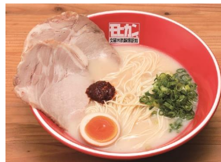
モヒカンらーめん