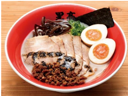
【京急百貨店オリジナル】