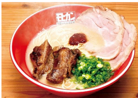
【京急百貨店オリジナル】