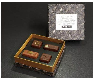
《Yoroizuka collection 2022》 (4コ入) 1,901円 (税込)