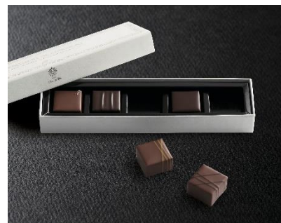
《ボンボンショコラ 5》 (5粒入) 2,001円 (税込)