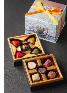
《サンク・エトワール プリュスクール》 (2段10コ入) 3,888円 (税込)