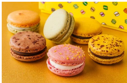
《マカロン詰合せ》 (6コ入) 2,808円 (税込)