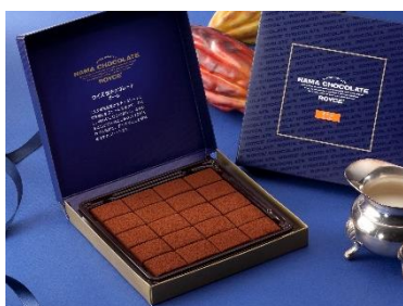
《生チョコレート (オーレ)》