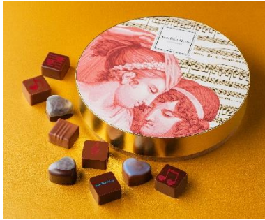
《ボンボン ショコラ 9個 メロディ》 (9コ入) 4,985円 (税込)