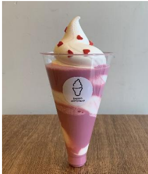
《バレンタイン ルビーチョコソフト》