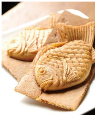
《京たいやき 小倉あん》