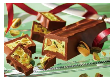
《ピスターシュショコラ》