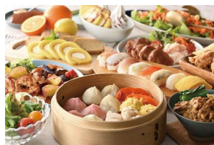
※写真はイメージ画像です。