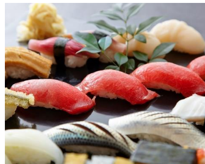
※写真はイメージ画像です。